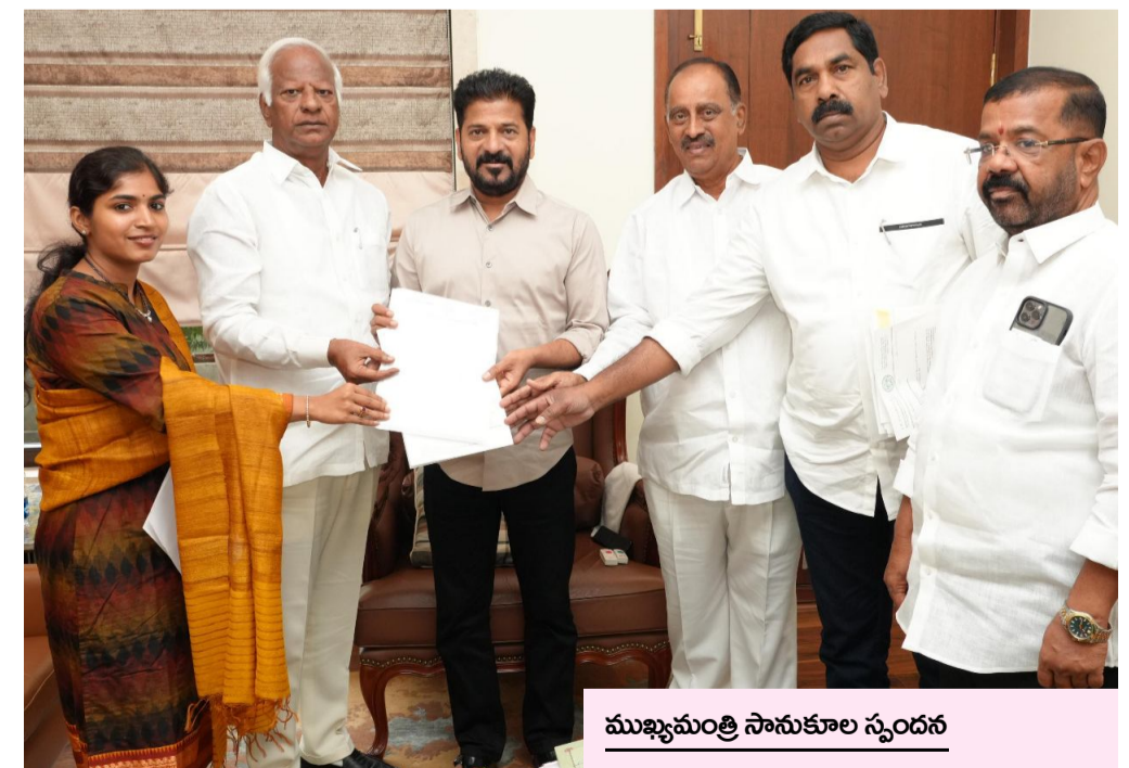
ముఖ్యమంత్రి సానుకూల స్పందన

ప్రస్తుతం వరంగల్ లో జవహర్ లాల్ నెహ్రూ స్టేడియం ఒక్కటే ఉందని, ఇది జిల్లా క్రీడా అధికారి ఆధ్వర్యంలో వివిధ క్రీడలకు సేవలందిస్తోందని తెలిపారు. నగరం విస్తరిస్తుండటంతో ప్రస్తుత స్టేడియం అవసరాలు తీర్చలేకపోతోందని వివరించారు. ఉమ్మడి